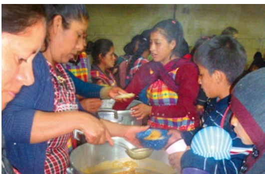
Oben: Lachen verbindet – beste Freundinnen im Kinderdorf. Unten: Warme Mahlzeiten für die Ärmsten.

Hier wurden 2023 über 65 000 Essen und Lebensmittelpakete verteilt. 400 Kinder und 231 Familien wurden mit Nahrung versorgt und auch sozialpädagogisch und medizinisch betreut.